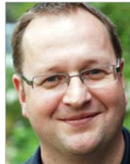
Kai Noster Anzeigenverkauf